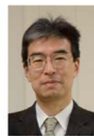
邑瀬 邦明 教授